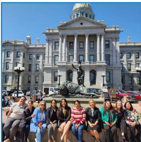
Líderes latinos en el capitolio para hablar con representantes estatales

En colaboración con un abogado local, SANA lanzó una campaña de concientización para reducir el estigma y el miedo asociados con los programas públicos de asistencia alimentaria. La campaña tuvo más de 1,772 visitas y fue compartida por Hunger Free Colorado.